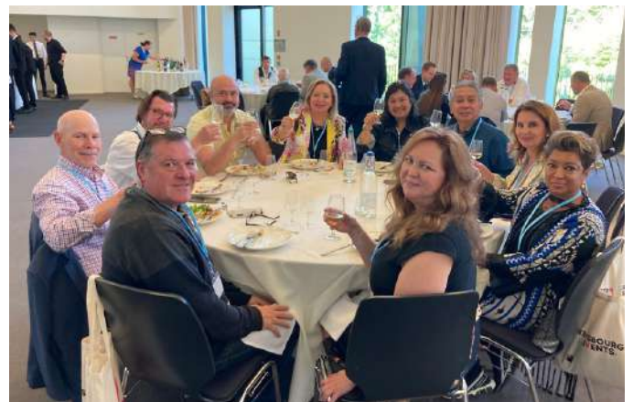
Afrique du Sud, Australie, Canada, France, Japon, Roumanie, Suisse, Royaume-Uni et États-Unis autour d'une même table !

Une envie de participer également pour les 63 juges experts des 5 continents qui pour certains étaient empêchés de voyager depuis l'Afrique du Sud, l'Australie, le Canada et les États-Unis.