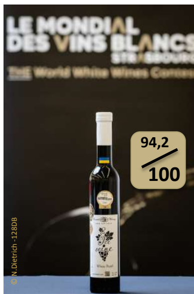
Le coup de Coeur de la première participation : White Pearl 2017 KOVACH Winery, UKRAINE